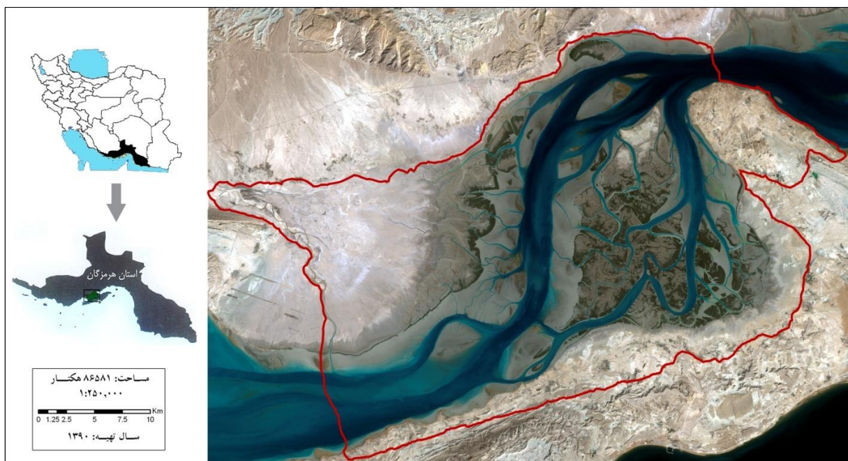
شکل ۱. موقعیت منطقه مورد مطالعه

با توجه به اینکه دریا یکی از منابع مهم با امتیازهای ویژه برای تأمین قسمتی از نیازهای بشر طی تاریخ بوده و هست؛ بنابراین حفظ محیط‌زیست آن و جانورانی که در آن زندگی می‌کنند در تداوم زندگی انسان‌ها نقش بسزایی دارد. از سوی دیگر، استفاده اقتصادی از پرندگان آبی قابل شکار همواره از مسائل مورد بحث در جوامع بومی حاشیه بوم‌سازگان‌های تالابی و رودخانه‌ای بوده است و جوامع بومی و محلی همیشه سعی در بهره‌برداری از حیات‌وحش