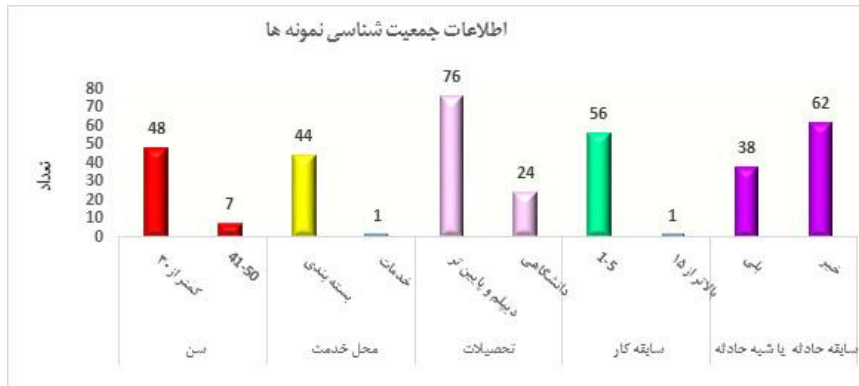
شکل ۱. اطلاعات دموگرافیک افراد شرکت کننده

اینکه کدام مولفه بیشترین اهمیت را دارد و آزمون ضریب همبستگی فی (Phi) و آزمون واریانس یک طرفه (ANOVA) جهت سنجش رابطه میان میانگین جو ایمنی کل و ابعاد جو با متغیرهای جمعیت شناختی تحقیق می‌باشند.