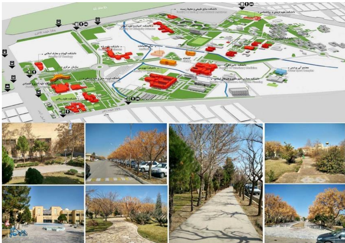
شکل ۱. دانشگاه فردوسی مشهد و تصاویری از مجموعه. مأخذ: وبسایت دانشگاه فردوسی مشهد، ۱۳۹۶. تصاویر از نگارندگان

در این بررسی روش تحقیق از نوع توصیفی - تحلیلی است و برای به دست آوردن اطلاعات از ابزار پرسشنامه استفاده شد.