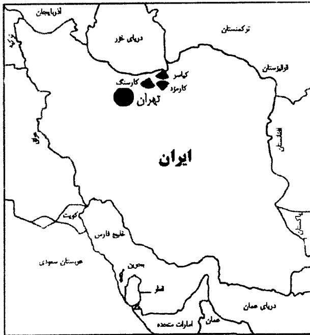
شکل شماره ۱: موقعیت جغرافیایی معدن شرکت زغال سنگ

در این رهگذر نیز از روش فلوکولاسیون و فلوکولاسیون انتخابی جهت بازیابی و کاهش ذرات معلق در پساب کارخانه استفاده شده است که در بخش های مختلف این مقاله به شرح آن پرداخته می شود. (شکل شماره ۱).