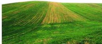
شخم در جهت شیب زمین