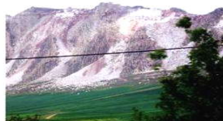
تخریب منابع طبیعی، جهت برداشت منابع معدنی