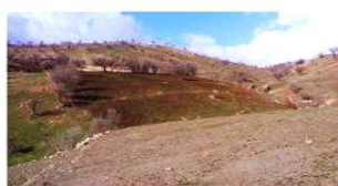
جنگل‌زدایی و کشت در جهت شیب زمین

شکل شماره (۲): بخشی از عوامل تخریب محیط زیست در منطقه هورامان