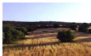
کشاورزی غیرقانونی در محدوده‌ی منابع طبیعی