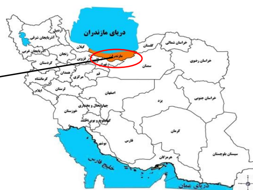
الف: استان مازندران