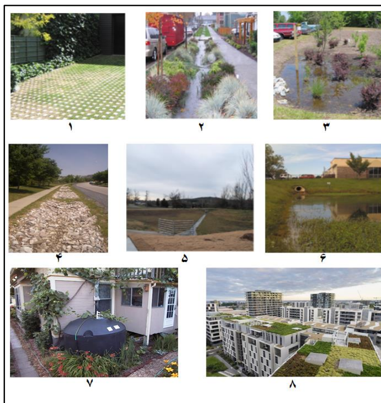
شکل ۲. انواع زیرساخت‌های سبز. ۱: کف‌سازی نفوذپذیر، ۲: جوی سبز، ۳: باغچه باران، ۴: ترانشه نفوذ، ۵: برکه نگه‌داشت، ۶: برکه نگه‌داشت زیستی، ۷: سیستم جمع‌آوری آب باران، و ۸: بام سبز

شده در چهار مقیاس رتبه‌ای بدون تاثیر (N)، تاثیر کم (L)، تاثیر متوسط (M)، تاثیر زیاد (H) تقسیم بندی شدند. سپس امتیازدهی به این معیارها از یک تا چهار صورت گرفت. نظر به تعیین وزن نسبی معیارها و زیرمعیارها در گام دوم، ماتریس تصمیم‌گیری جهت اولویت‌بندی زیرساخت‌های سبز در دسترس قرار گرفت. جدول ۲ نتایج مرور متون علمی در ارتباط با توانایی اشکال مختلف زیرساخت‌های