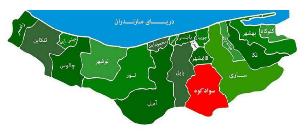
شکل ۱. موقعیت جغرافیایی شهرستانهای سواد کوه و سیمرغ

در مطالعه حاضر بر اساس نتایج حاصله از آنالیز دادههای در دسترس برای هر یک از شهرستانهای استان