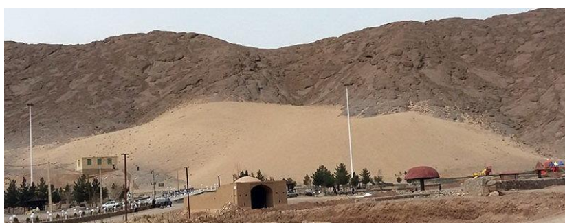
شكل ۱. كوهريگ بغداد آباد مهربز در استان يز

از نمونه‌هاى بارز اين مناظر فرازمينى چهره‌هاى فرسائى‌اند؛ كه كوهريگ‌ها نمونه‌اى از اين مناظر است. اين مناظر، از نظر تاريخى، طبيعى و فرهنگى براى بسيارى