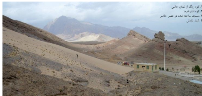
شکل ۳. نمایش کوه‌ریگ از بدنه جانبی ۱۳۹۳.

به‌رغم کشش کوه‌ریگ، این پدیده که در منطقه گرمسیری است آمادگی حضور مردم را در آغوش و بستر خود داشته است. موقعیت کوه‌ریگ، و هم کوه مجاور، مکان تجمع ریگ‌ها را در سایه و شرایط مطلوب قرار می‌دهد (شکل ۳). این حسن طبیعی باعث می‌شود تا از داغی و سوزاندگی ریگ‌ها کاسته شود و درجه حرارت آن، به حد بسیار مطلوبی برسد. از طرفی دیگر، در قدیم، در راستای مسیر منتهی به کوه‌ریگ، مناظر سایه‌انداز باغی و کشاورزی گسترش بیشتری داشته است.