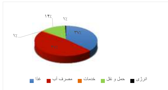
شکل ۳. رد پای اکولوژیکی حوضه آبخیز کال شور به تفکیک بخش‌های مصرف

با توجه به شکل ۳، از کل مساحت موجود در حوضه آبخیز کال شور، بخش مصرف آب با ۴۷٪ بالاترین و بخش