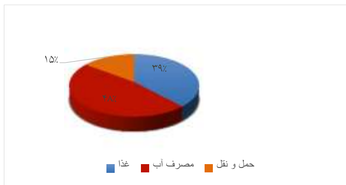
شکل ۴. ردپای اکولوژیکی حمل‌ونقل، مصرف آب و غذا در حوضه آبخیز کال‌شور

توجه به مساحتی که دربرمی‌گیرد و در مقایسه با مساحت منطقه کمتر است، تأثیر چندانی بر ناپایداری اکولوژی ندارد.