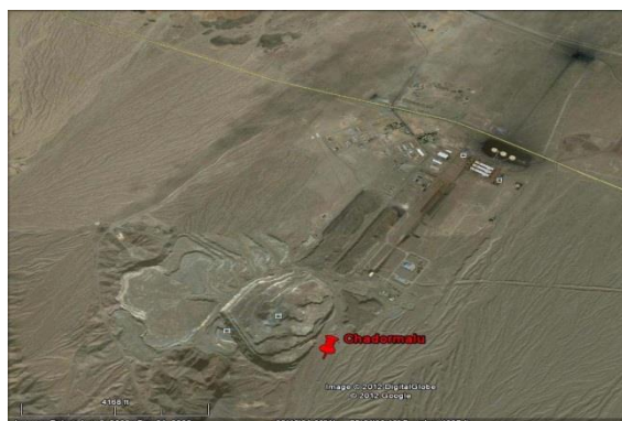
شکل ۴. تصویر ماهواره‌ای معدن سنگ‌آهن چادرملو

معدن چادرملو در استان یزد (شکل ۴) با مشخصات جغرافیایی ۱۷° ۳۲' عرض شمالی و ۵۵° ۳۰' طول شرقی واقع شده است. کانسار از چهار بیرون‌زدگی سنگ‌آهن با ارتفاع ۱۵۰ تا ۲۵۰ متر بالاتر از مناطق اطراف تشکیل شده و سه بیرون‌زدگی شمالی که در عمق به هم متصل می‌شوند، توده شمالی را تشکیل می‌دهند و حدود ۸۰ درصد ذخیره را دربر می‌گیرند. با توجه به مجاورت با کویرهای مرکزی و لوت، منطقه دارای آب و هوای گرم و خشک بیابانی است و متوسط درجه حرارت آن تا ۲۰/۸ درجه سانتی‌گراد گزارش شده است (National geosciences database of Iran, 2009).