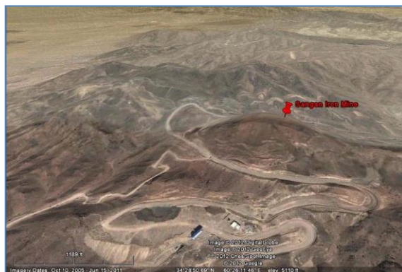
شکل ۳. تصویر ماهواره‌ای معدن سنگ‌آهن سنگان برداشت از Google Earth

تعداد ۴۰ معیار و زیرمعیار شناسایی شده در قالب پرسش‌نامه برای دریافت نظرهای تیم مطالعاتی تنظیم شد. سیستم‌های تصمیم‌گیری چندمعیاره حوزه‌های دانش مختلفی را دربر می‌گیرند (Huang et al., 2011) و تجربه و دانش فنی گروه کارشناسی به اثربخشی روش و صحت نتایج حاصله کمک می‌کند (Rowe & Wright, 1999). بنابراین، تیم کارشناسی هدف در سه گروه استادان دانشگاه