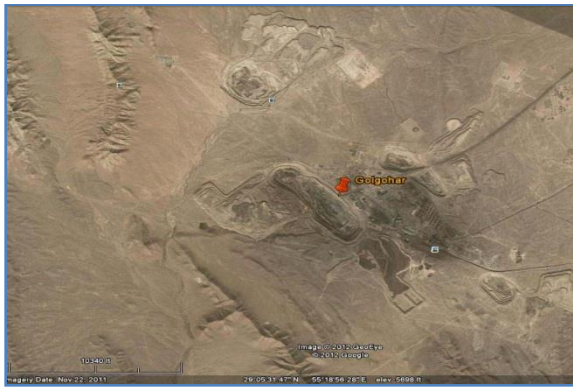
شکل ۲. تصویر ماهواره‌ای معدن سنگ آهن گل گهر

معدن سنگ آهن گل گهر در استان کرمان (شکل ۲) در طول جغرافیایی 19^{\circ} 55' شرقی، عرض جغرافیایی 29^{\circ} 07' شمالی واقع شده است. این توده معدنی در دشت مرتفعی با ارتفاع متوسط ۱۷۵۰ متر از سطح دریا در ناحیه نیمه کوهپایه‌ای واقع است و با کوه‌هایی به ارتفاع ۲۵۰۰ متر و بیشتر با امتداد شمال غرب - جنوب شرق احاطه شده است. پوشش گیاهی این ناحیه بسیار اندک و پراکنده و بیشتر به صورت بوته و گیاهان وحشی مقاوم در مقابل خشکی و گرم است. در این ناحیه رود دائمی جریان ندارد و آب مورد دسترس در بسیاری از اوقات سال متکی به مقدار آب چشمه‌های پراکنده است (mining and Golgohar industrial Co. 2009).