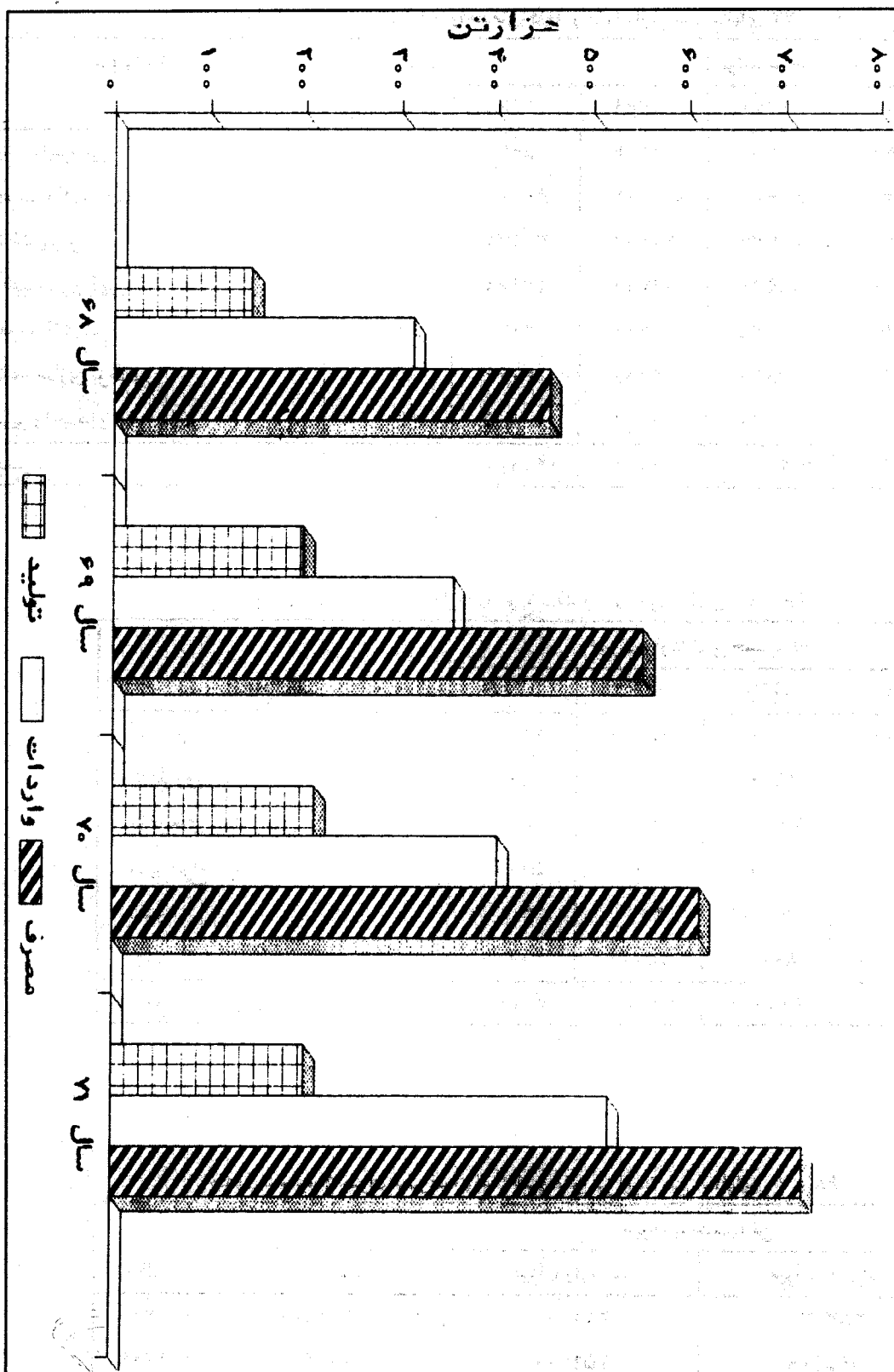
نمودار شماره ۱: میزان مصرف انواع کاغذ و مقوا در ایران طی سالهای ۷۱ - ۷۶ - ۱۳۶۸