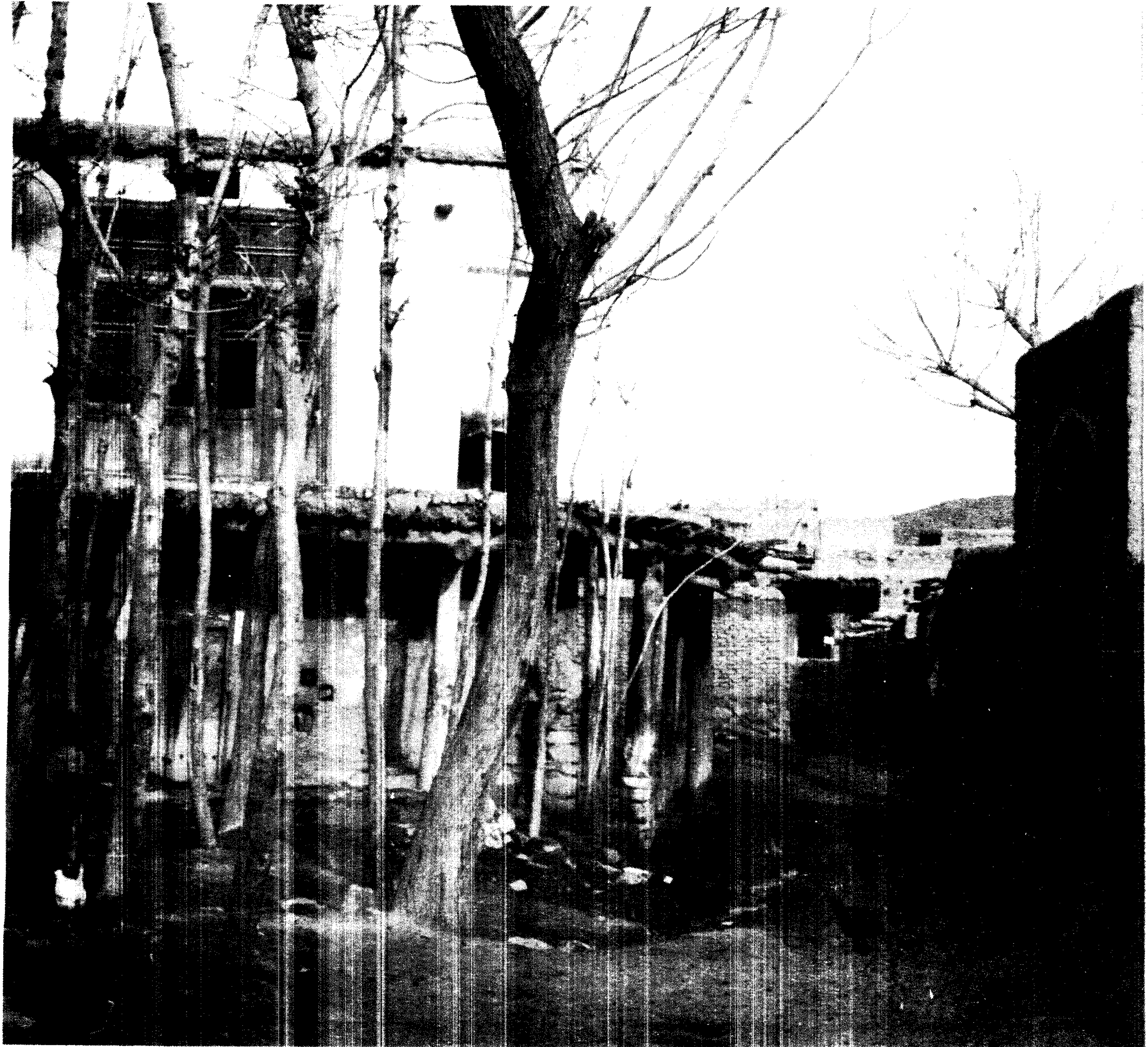
مرکز هماهنگی مطالعات محیط زیست