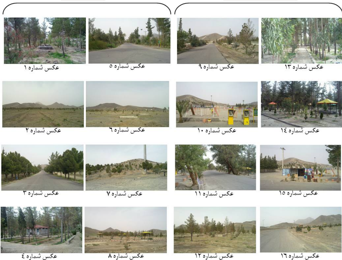
شکل ۳. عکس‌های برگزیده از پهنه‌های پارک جنگلی ملت زاهدان به منظور ارزیابی بصری منظر

بالاتر از ۵۹ سال سن داشتند، ۱۲ معیار کلیدی تعیین‌کننده مطلوبیت و نامطلوبی بصری منظر پارک، استخراج شد که از این میان ۶ معیار بیانگر زیبایی و ۶ معیار نشان‌دهنده نازیبایی‌اند (جدول ۱). بر اساس نظرسنجی، نتایج