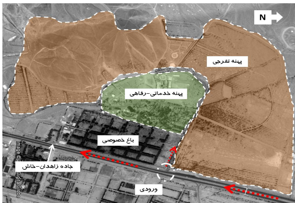
شكل ۱. عكس هوايى از موقعيت پارك ملت زاهدان، كاربرى هاى اطراف و پهنة بندى آن

الف- پهنة تفرجى: اين پهنة با مساحتى بالغ بر ۹۰ هكتار كه درصد بيشتر آن را فضاهاى جنگلى دست كاشت، تپه و كوه ها تشكيل مى دهند، به منزله وسيع ترين پهنة