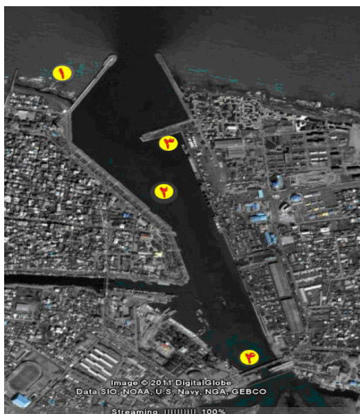
شکل شماره (۱): موقعیت ایستگاههای نمونه برداری در

بندر انزلی در بخش غربی سواحل جنوبی دریای خزر قدیمی‌ترین بندر ایران در این دریا بوده و بیش از ۱۲۰ سال از عمر آن می‌گذرد. این بندر در باریکه بین تالاب انزلی و دریای خزر قرار گرفته و دارای دو بازوی موج شکن سنگی است که حوضچه بندر را تشکیل می‌دهند (شکل شماره ۱).