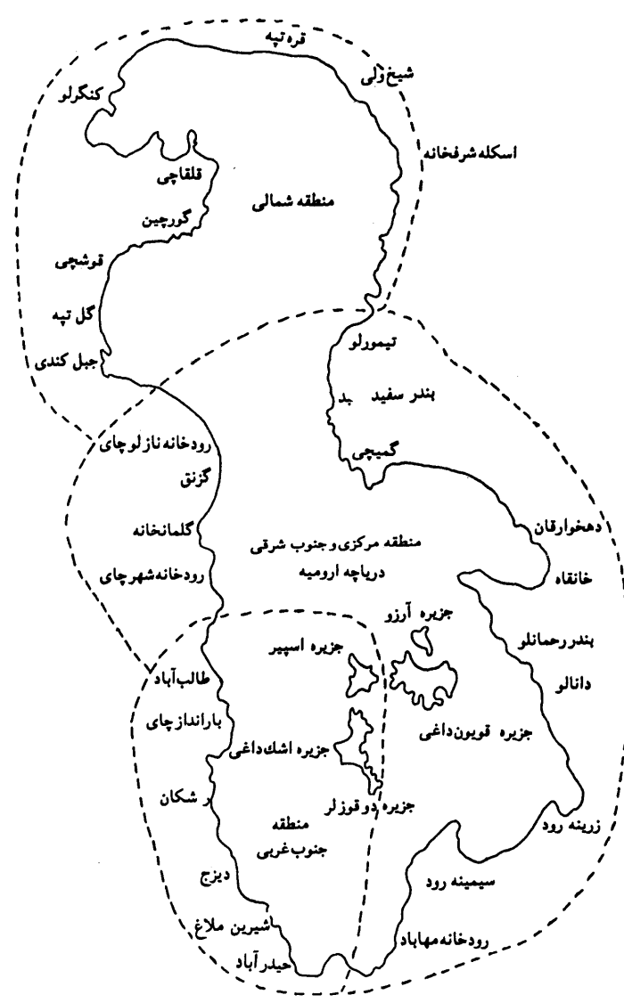
شکل ۱ - منطقه بندی غلظت آب دریاچه ارومیه در اردیبهشت ماه

کیفیت فیزیکی و شیمیایی آب دریاچه مذکور در کم‌آب‌ترین زمان یعنی حدود مهرماه در کلیه مناطق و اعماق مختلف تقریباً برابرند و این امر به معنی نوعی یکنواختی نسبی در کیفیت آب دریاچه در نقاط و عمقهای مختلف می‌باشد. لازم به